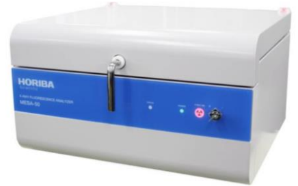
蛍光X線元素分析装置 MESA-50 (左) 大型試料室モデル MESA-50K (右)