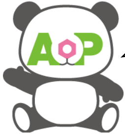
イメージキャラクター AOPanda