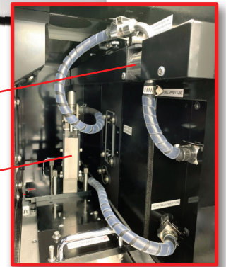
Celda para unidad de imagen