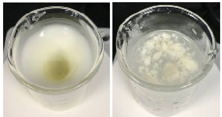
Figure 3. Dispersion of popular vegan mayo (left) and generic vegan mayo (right) in water

Este estudio muestra algunos ejemplos de la efectividad de la técnica de difracción láser del LA-960 para determinar el rango óptimo de tamaño de partícula para la mayonesa y, en particular, la importancia de utilizar datos de tamaño de partícula para predecir la estabilidad de la emulsión, el comportamiento reológico y las características sensoriales. Los consumidores de hoy en día están dispuestos a pagar un precio superior por un producto innovador «más saludable» si se conserva el tamaño de las partículas.