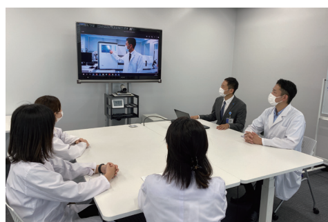
ご施設でのイメージ

WEBカメラを使い、画面や操作の流れ、製品内部の動きなど細部までご確認いただけます。