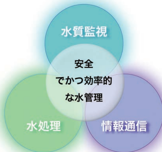
Figure 1 効率的な水管理を実現するための水質計測技術の概念図

水質を目的の品質に管理するために評価が必要となる項目は、用いられる水の役割によって大きく異なる場合もあるが、例えば飲み水の場合は安全あるいは安心を担保できる項目となるべきである。また、水管理の観点からは、ただ単に「計測できる」というだけでなく、「どのような頻度でどのようなスピードで計測結果が得られるか」も水質の適性管理には大変重要な要素となる。例えば、米国では4時間毎の濁度モニタリングが課せられているように [3] 、新しい迅速簡便な評価・計測技術が必要となってくる場合もある。更に、「その測定が現場で可能なのか、あるいは実験室や計測所へ持ち帰って来ないと測れないのか」も求められる計測技術レベルが大きく異なる。もちろん、項目だけでなく、その管理レベルにより計測感度の課題も掲げられ、水計測